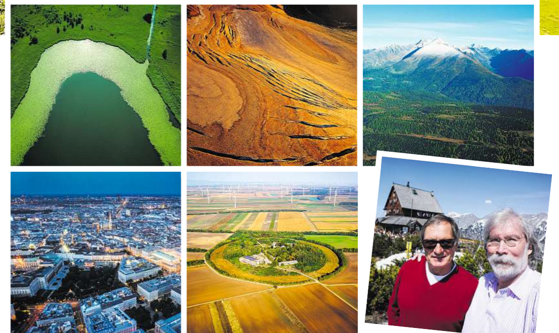
Überflieger: Franz Klammer (re.) fungiert in Georg Rihas Doku-Vierteiler als prominenter Flugbegleiter

Ab dieser Woche soll die dritte Staffel von „Über Österreich“ an die Quotenerfolge der Jahre 2016 (Jahreshöchstwert für ORF III) und 2017 an-